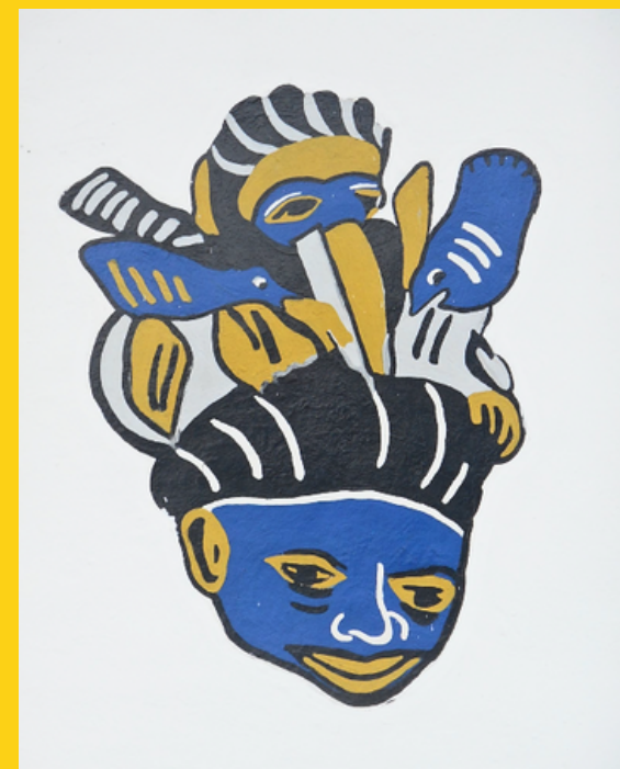
Murale przedstawiające maskarady i maski