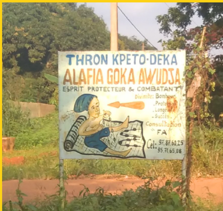
Szyld reklamujący usługi wróżbiarskie