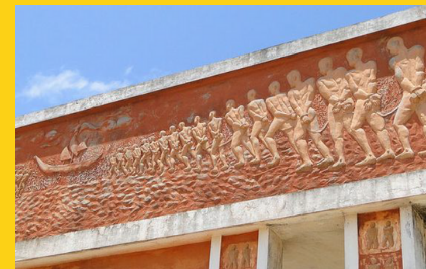
Pomniki na Drodze Niewolników