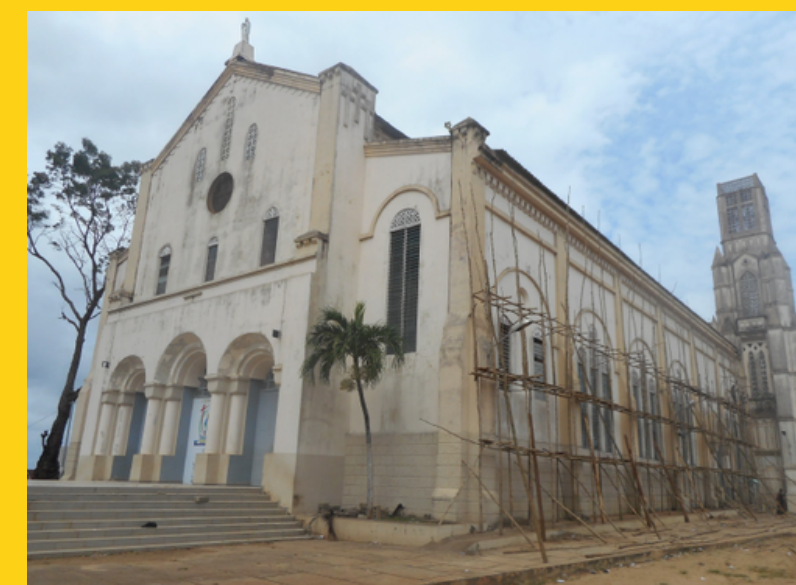
Katedra w Porto-Novo