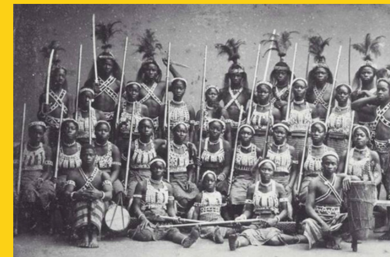
Amazonki z Dahomeju

Znaczenie: Jedno z najważniejszych miejsc kultu w religii voodoo. Wąż – symbol mocy duchowej i odrodzenia – jest tutaj czczony jako święte zwierzę. Świątynia przyciąga pielgrzymów i ciekawych turystów z całego świata. Ukazuje, jak tradycyjne wierzenia przetrwały trudy epoki kolonizacji.