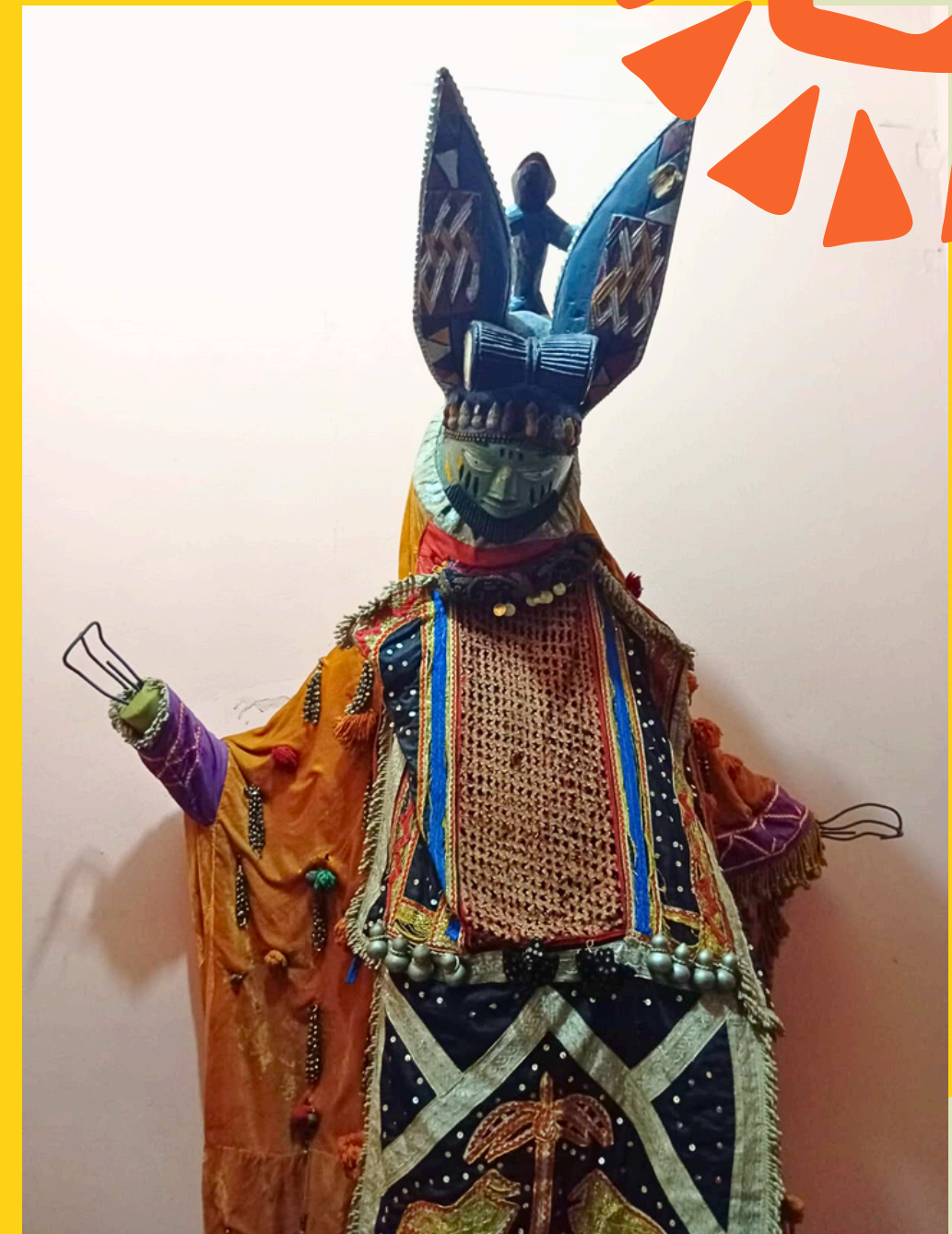
Tradycyjne maski i stroje Gelede