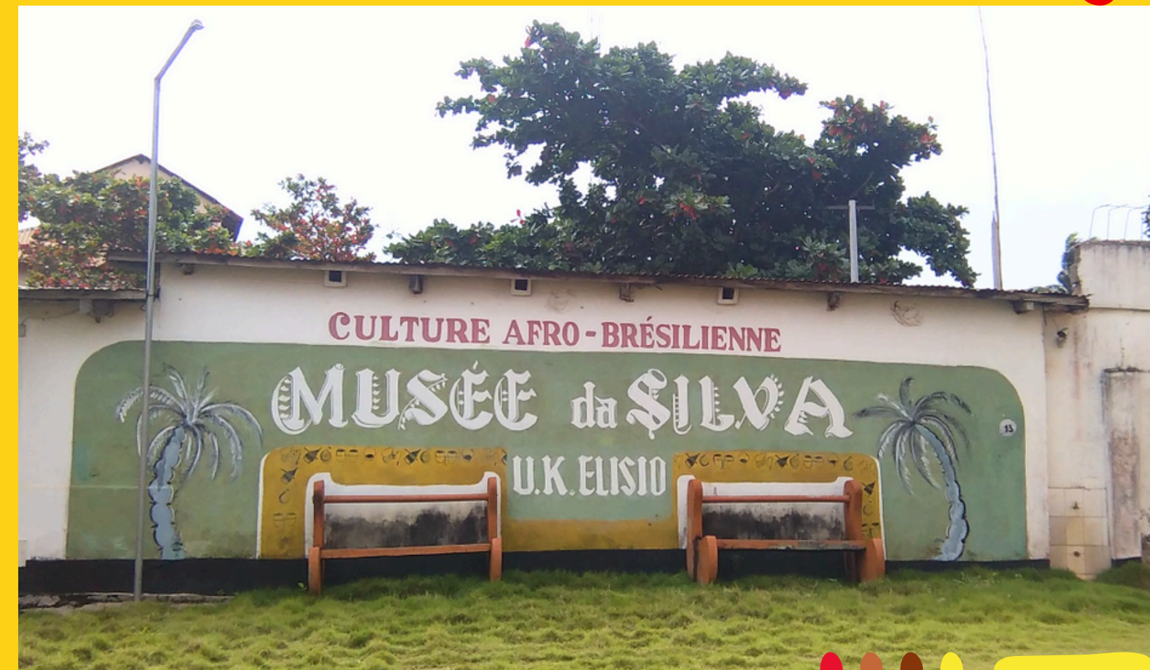
Muzeum kultury afro-brazylijskiej