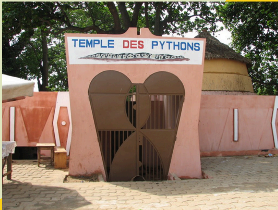
Świątynia Pytonów