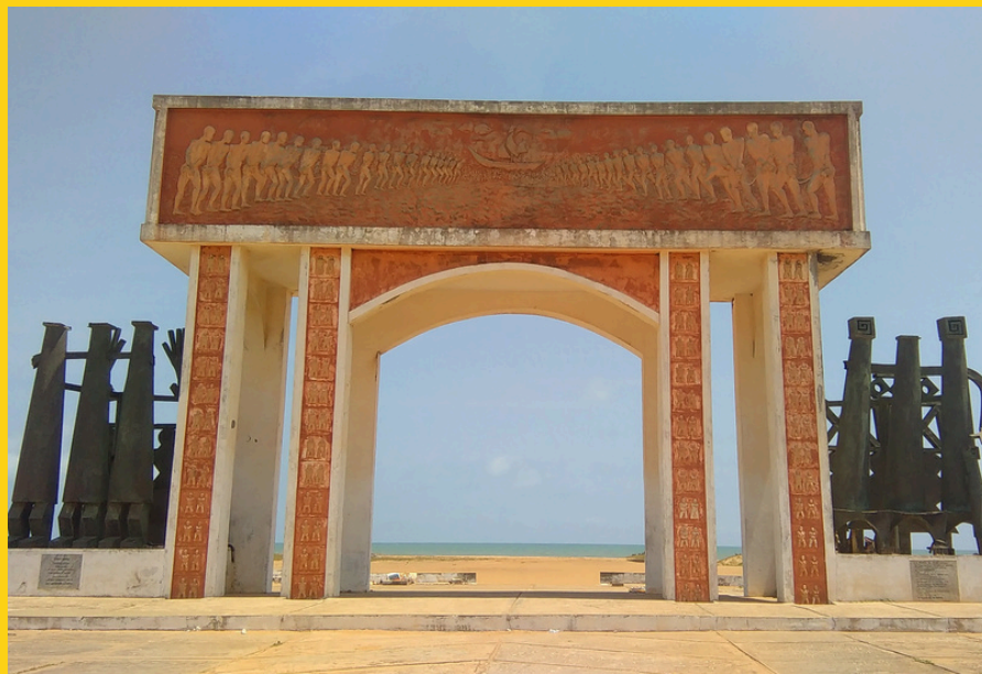
Brama Bez Powrotu w Ouidah – symbol pamięci o handlu niewolnikami