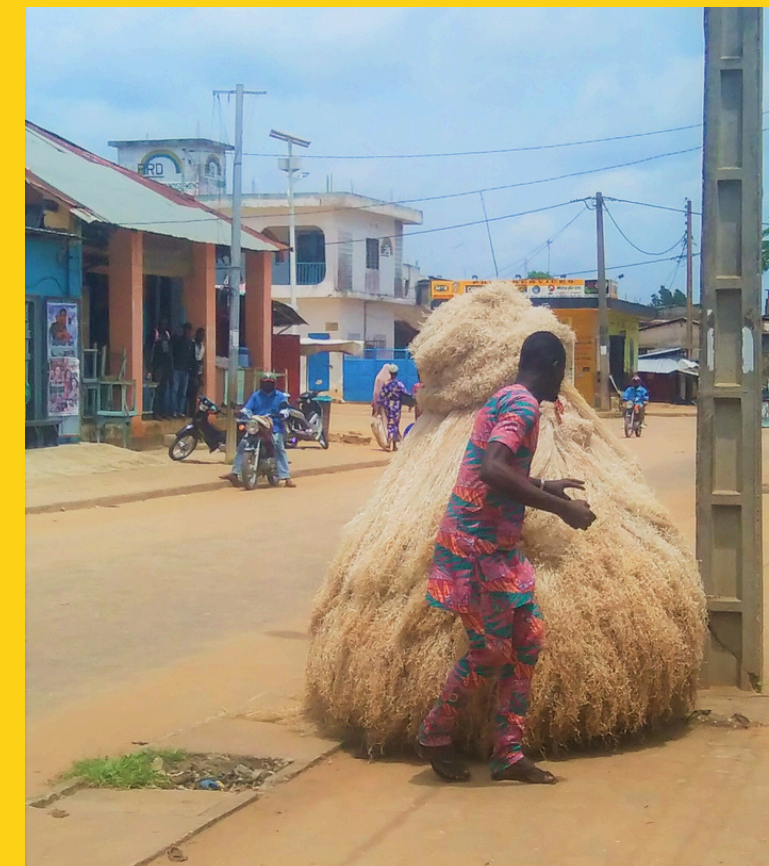
Pokaz Zangbeto w Beninie

Edukacja pozostaje wyzwaniem – choć poziom alfabetyzacji rośnie, wiele dzieci, szczególnie na terenach wiejskich, nie kończy szkoły podstawowej. Służba zdrowia również pozostaje słaba, a dostęp do opieki medycznej – ograniczony.