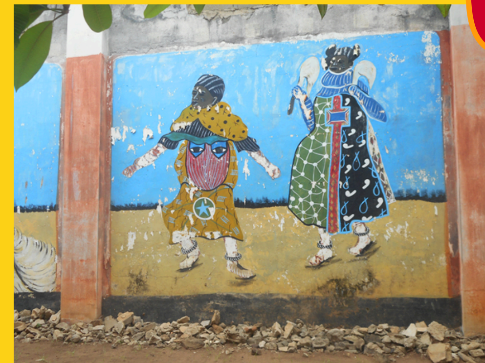
Murale przedstawiające maskarady