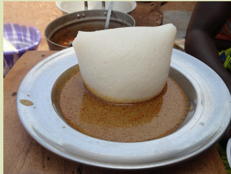
Akassa (fot. Google)