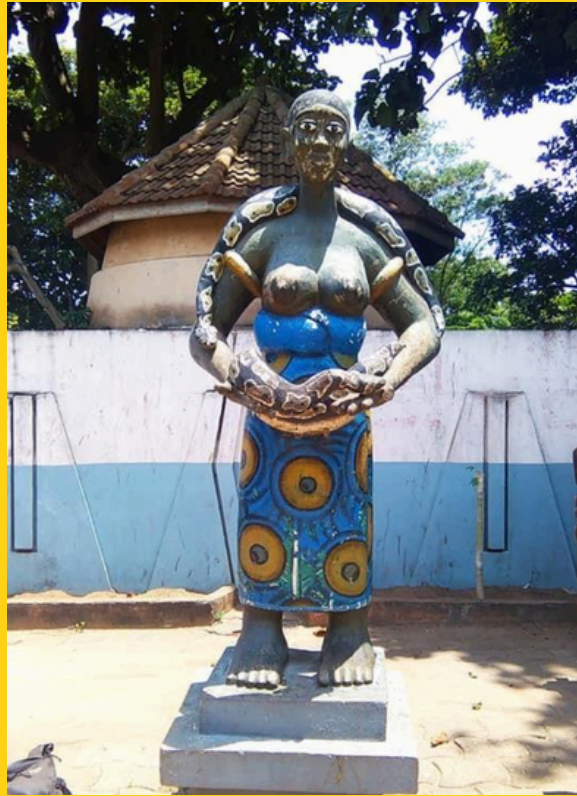
Pomnik w Ouidah