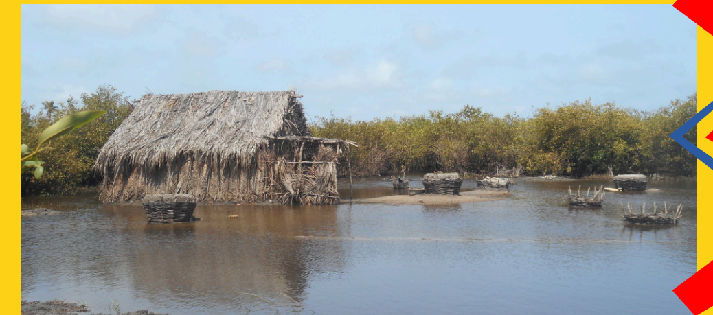
Pływające miasto

Pływające miasto Ganvié - Ganvié to całe miasto zbudowane na wodzie, na jeziorze Nokoué. Domy stoją na palach, a mieszkańcy poruszają się wyłącznie łodziami. Miasto zostało założone około XVII wieku przez lud Tofinu, którzy uciekali przed handlarzami niewolników z imperium Dahomeju. Wierzenia tamtych ludów zabraniały prowadzenia wojen na wodzie, dlatego Tofinu budując swoje domy na palach pośrodku jeziora, chronili się przed porwaniami i niewolą. Szacuje się, że ponad milion osób zostało stąd wywiezionych głównie do Ameryk. Do dziś zachowała się tzw. „Droga Niewolników”, którą prowadzono jeńców na statki. Ganvié jest jednym z największych pływających osiedli na świecie i liczy dziś ponad 20 000 mieszkańców.