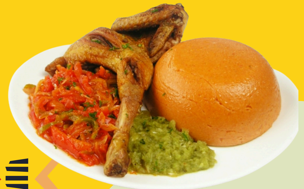
Pâte rouge (Google)