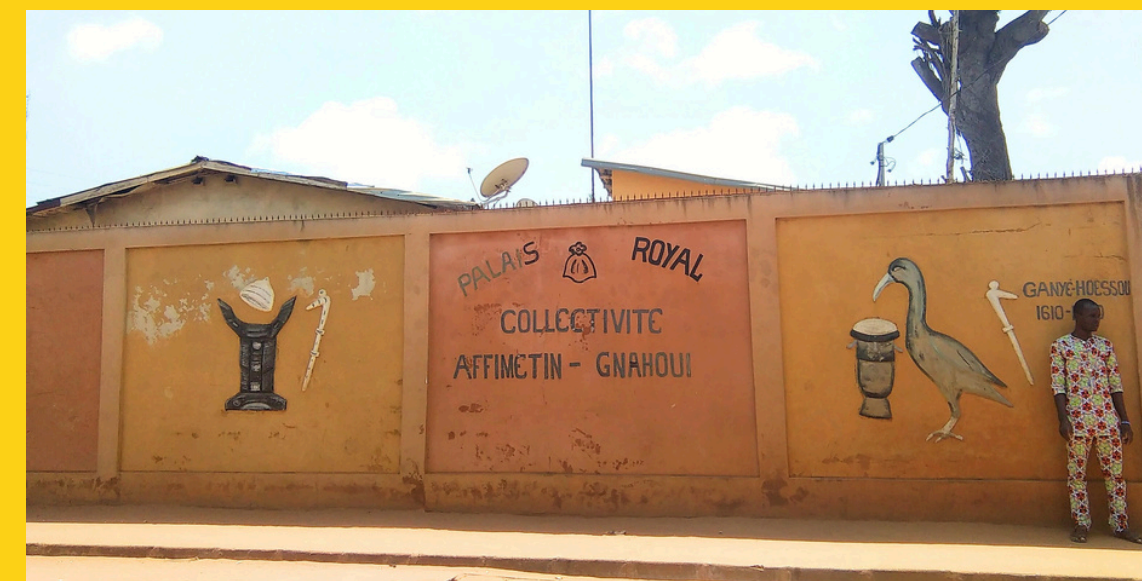
Pałac w Beninie

Dziś Benin jest jednym z nielicznych krajów regionu, który przeprowadza regularne wybory i cieszy się względną stabilnością polityczną.