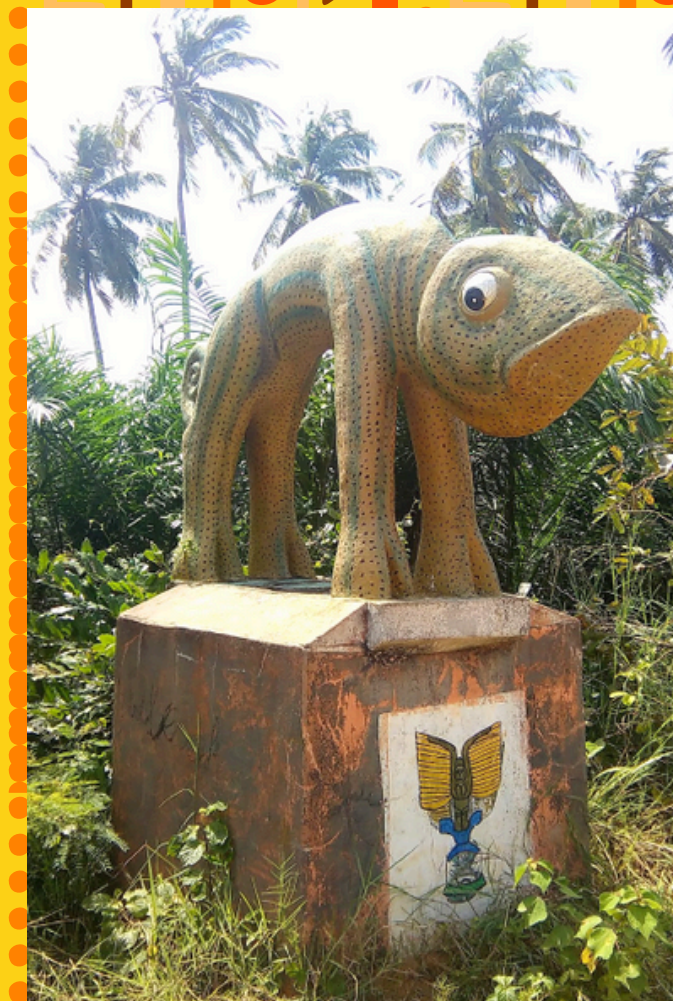
Pomnik na Drodze Niewolników

SMS-y... z wróżbą - W niektórych regionach, szczególnie na północy kraju, mieszkańcy korzystają z usług wróżbitów. Przepowiadanie przyszłości odbywa się także cyfrowo poprzez wysyłanie SMS-a z pytaniami o przyszłość. Usługa łączy lokalne wierzenia z nowoczesną technologią.