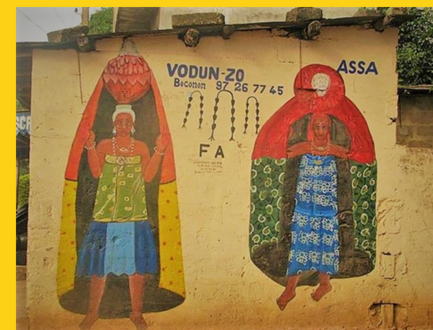
Mural z przedstawieniami voodoo