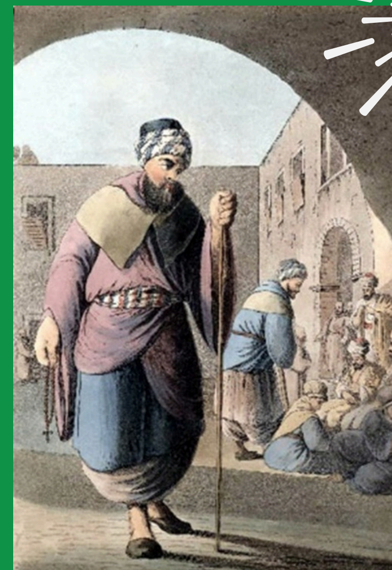
Maronicki mnich i pielgrzymi

Patriarcha dysponuje pełną władzą mianowania maronickich arcybiskupów i biskupów. Zwołuje on święty synod raz na trzy lata, poświęca krzyżmo, wydaje werdykty ostateczne w wypadkach apelacji od niższych sądów, w sprawach dotyczących prawnego statusu osobowego, kontroluje zgodność tekstów z oryginałem i wtórne wersje liturgii. Tylko patriarcha może udzielić rozgrzeszenia niektórych grzechów ciężkich takich jak: apostazja, użycie naczyń liturgicznych do czarów, usiłowanie zabójstwa biskupa lub wygnanie kapłana z parafii. Imię patriarchy jest wymieniane we wszystkich modłach po imieniu papieża (Atiya, 1978: 354). Do XV w. nie miał on swojej siedziby, każdy z kolejnych zwierzchników kościoła maronickiego rezydował w wybranym klasztorze, mógł się przemieszczać, jeśli wymagała tego sytuacja. Dziś funkcję siedziby patriarchy spełnia pałac w Bkirki (około 33 km na północny zachód od Bejrutu), latem rezyduje on w Kannubin. Diecezje Dżibajl (Byblos) i Batrun są zarezerwowane dla patriarchy.