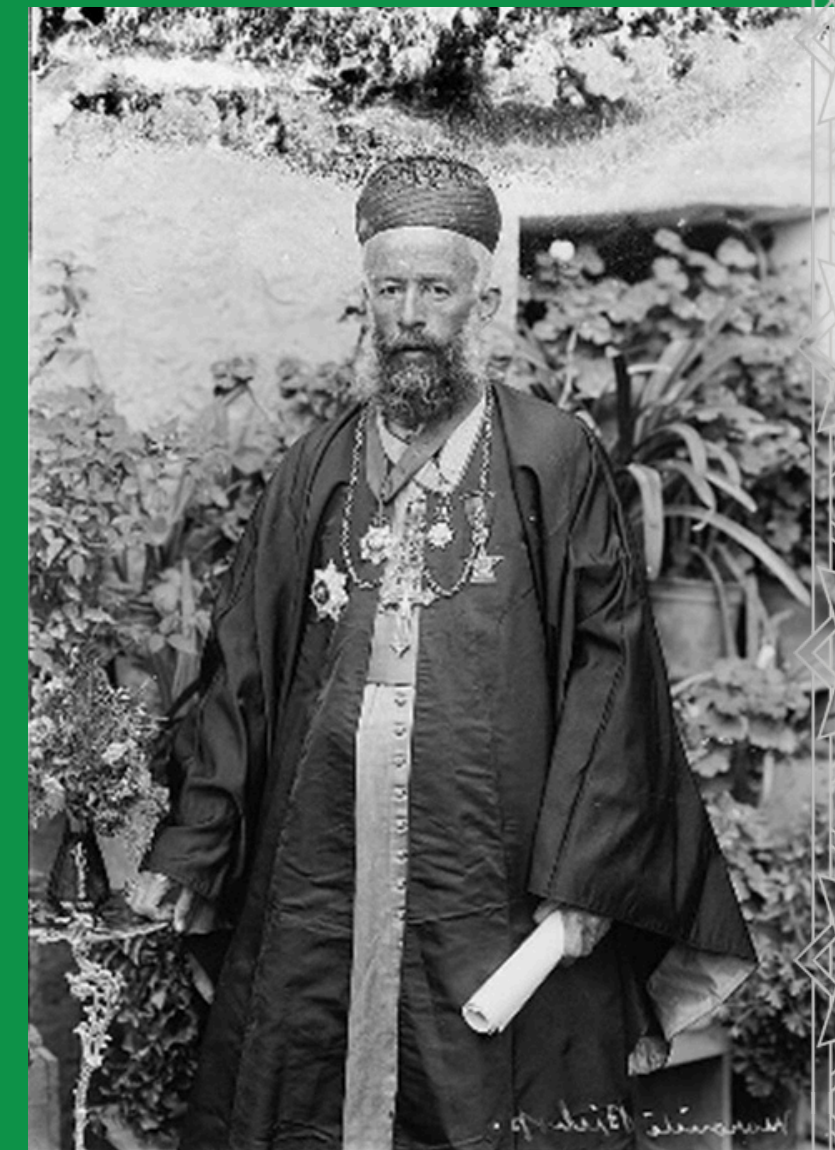
Mężczyzna w stroju druzyjskim

Szyici przeważnie skoncentrowani byli na południu, przez co byli grupą najsilniej poszkodowaną w wyniku ataków izraelskich i okupacji Libanu do 2000 roku. Bastionem szyitów na południu były Tyr i Bint Dżubajl. Tradycyjnie zdominowana przez szyitów była też północna część Doliny al-Bika, wokół fenickiego Baalbak i Al-Hirmil. Liczne osiedla szyickie powstały także na południowych przedmieściach Bejrutu w rezultacie migracji – Al-Dahija oraz Harat Hrajk. Ta ludność napływała do stolicy od lat 60. z południa kraju i z Doliny Al-Bika, w poszukiwaniu lepszych warunków do życia.