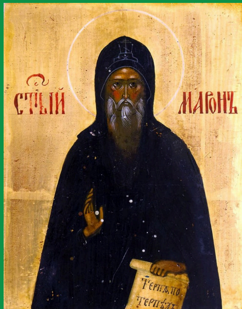
Św. Maron

Najwcześniejsze udokumentowane źródła chrześcijaństwa w Libanie odnoszą się do IV w. n.e., kiedy to pustelnik, św. Maron (Maro lub Marun), założył w dolinie rzeki Orontes wspólnotę, do której wstąpiło ośmiuset mnichów by razem głosić Ewangelię na ziemiach syro-libańskich. Potwierdzenie działalności mnicha Marona znajdujemy w listach Jana Chryzostoma oraz pismach Teodoretą z Antiochii, biskupa Cyru. Po śmierci św. Marona, na miejscu jego grobu zbudowano klasztor, który z czasem stał się ważnym sanktuarium.