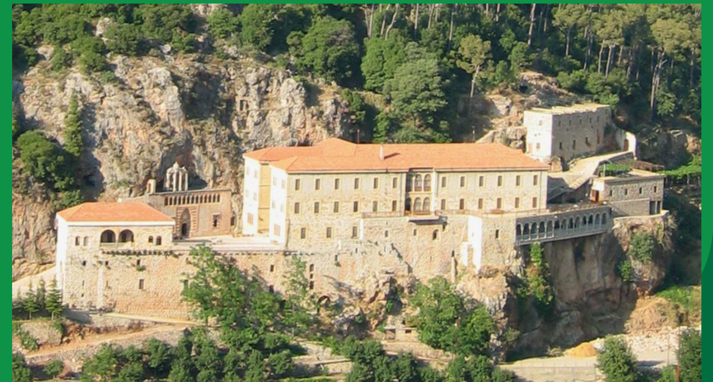
Klasztor św. Antoniego, Kozhaya/Zgharta

Reguła monastyczna jest ściśle związana z Kościołem maronickim od zarania jego dziejów. Św. Maron w IV w. był pierwszym, który złożył śluby czystości, ubóstwa i posłuszeństwa, a które jego liczni następcy zachowywali. Założyciel Kościoła maronickiego, św. Jan Maron, także popierał i cenił życie zakonne, toteż w Libanie wzrastała liczba klasztorów, zgromadzeń zarówno męskich jak i żeńskich. Działalność tych placówek, szczególnie pod względem edukacyjnym, miała ogromne znaczenie dla rozwoju kultury libańskiej.