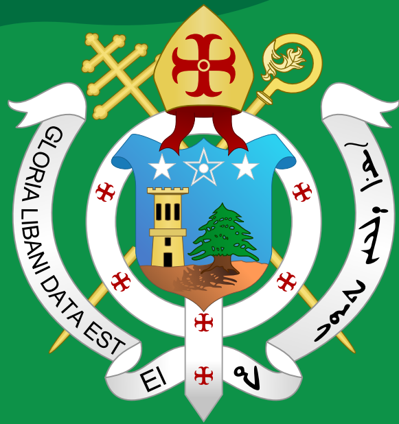
Herb patriarchy maronickiego

Kościół w mentalności maronitów funkcjonował i nadal funkcjonuje jako naturalna najważniejsza forma zwierzchnictwa i władzy. Przez wieki duchowni nie izolowali się w swych klasztorach od reszty współwyznawców, a wspólnie z nimi dzielili trudy życia, angażując się zarówno w walkę (jak w czasie starć maronicko druzyjskich) jak i reprezentując interesy maronitów na arenie międzynarodowej (przykładowo na konferencji pokojowej w Paryżu 1918 roku, pozyskując przychylność Zachodu dla koncepcji państwa libańskiego na Bliskim Wschodzie).