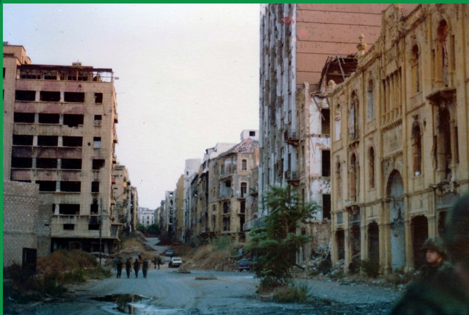
Fragment tzw. Zielonej Linii, granicy dzielącej Bejrut na wschodni (chrześcijański) i zachodni (muzułmański). Przestrzeń wzdłuż Zielonej Linii była bardzo niebezpieczna, opuszczone bloki i kamienice zajmowały bojówki i snajperzy

Argumentem przemawiającym za tym, że nie należy sprowadzać wojny domowej 1975-1990 do konfliktu muzułmańsko-chrześcijańskiego jest fakt, że trudno mówić o jednolitych frontach chrześcijańskim czy muzułmańskich. Sprawa palestyńska podzieliła muzułmanów – o ile sunnici i druzowie wspierali czynnie kwestię palestyńską jako słuszny odwet, obronę honoru arabskiego w walce z Izraelem, o tyle szyici byli już odmiennego zdania i ugrupowania szyickie – Amal i Hezbollah – walczyły z Palestyńczykami, którzy ściągali na szyitów (zamieszkujących przede wszystkim południe Libanu) krwawe odwety izraelskie. W pewnym okresie wojny natomiast obydwie partie szyickie zwróciły się przeciw sobie, rywalizując o przewodnictwo nad szyitami.