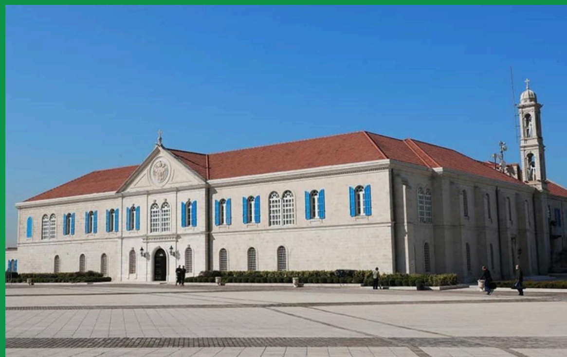
Siedziba patriarchy maronickiego w Bkerke

Hierarchia kościelna działała równolegle obok świeckiej, w przeszłości częste były przypadki łączenia funkcji religijnych i wojskowych. W obliczu zagrożenia niejedyn kapłan zamieniał się w walecznego żołnierza. Także w czasie wojny domowej maronicy mnisi odcisnęli swój niechlubny wkład w eskalację przemocy. Mnisi z klasztorów, szczególnie zlokalizowanych w Kaslik, nieopodal Bejrutu, oprócz przechowywania broni i zaopatrywania bojówek, sami tworzyli własne brygady, zwane