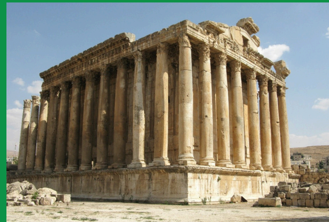
Świątynia Bachusa w Heliopolis