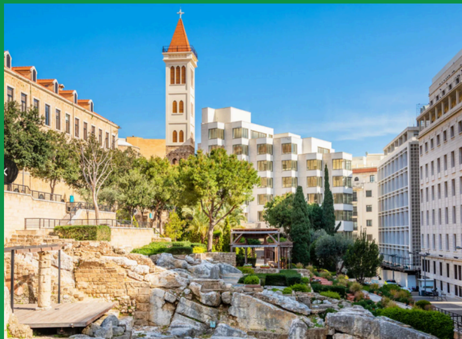
Ruiny łaźni rzymskich w Bejrucie