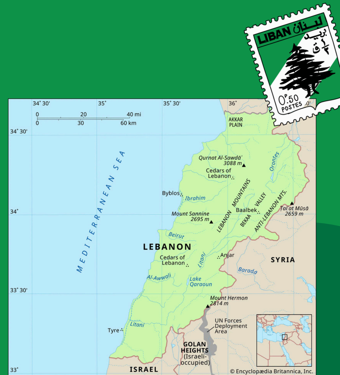
Mapa Libanu

03 Liban znajduje się w strefie klimatu podzwrotnikowego, o odmianie śródziemnomorskiej. Charakteryzuje się ona długim, upalnym i suchym latem trwającym od maja do września, ciepłą i deszczową wiosną oraz jesienią, a na wybrzeżu raczej łagodną zimą. W pasie nadmorskim rzadko kiedy temperatura spada poniżej zera, ale na terenach wyżej położonych i w górach zimą występuje śnieg. Liban ma dość gęstą sieć rzeczną, ale większość z nich to niewielkie rzeki i potoki, niektóre z nich tylko sezonowe. Największa rzeka kraju to Litani o długości 146 km, która wypływa z doliny al-Bekaa, a następnie przedostając się przez góry Liban na południu wpływa do Morza Śródziemnego.