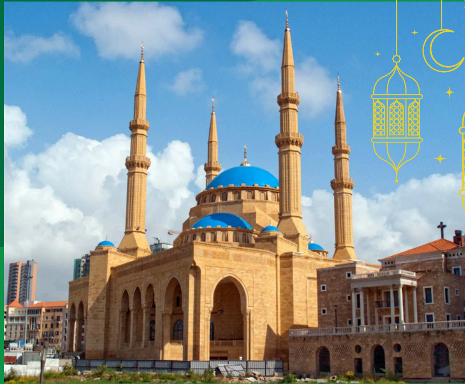
Meczet Mohammada al-Amina w Bejrucie