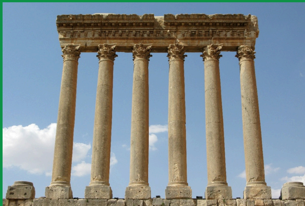
Kolumny ze świątyni Jupitera w Heliopolis

02. Po upadku Fenicjan w Libanie panowali Grecy, a potem Rzymianie. Ziemie libańskie były świadkiem narodzin chrześcijaństwa, powstawały tu pierwsze i najstarsze kościoły.