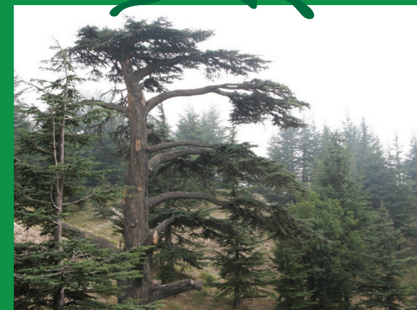
Cedr libański (Vyacheslav Argenberg)

Nazwa Liban (z arabskiego Lubnan) pochodzi od pasma górskiego o tej samej nazwie, ciągnącego się wzdłuż całego terytorium kraju, od północy aż do południa. Ma swoje źródło w semickich określeniach koloru białego i nawiązywało do bieli zaśnieżonych szczytów górskich, przy dobrej pogodzie widocznych z morza i lądu. Co ciekawe, naprzeciw góry Liban – niczym lustrzane odbicie – równolegle ku południu kraju biegnie pasmo górskie odpowiednio zwane Antyliban. Położone jest częściowo już na terenie Syrii i Izraela i oddzielone od góry Liban jedynie płaską i żyzną doliną al-Bekaa. Utrzymujący się przez wiele miesięcy na zboczach Libanu śnieg ściąga z całego Bliskiego Wschodu wielu amatorów niszowego w tym regionie narciarstwa.