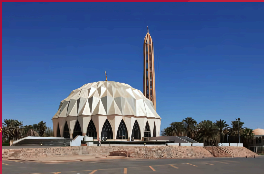
Meczet Al-Nilin w Omdurmanie, Chartum