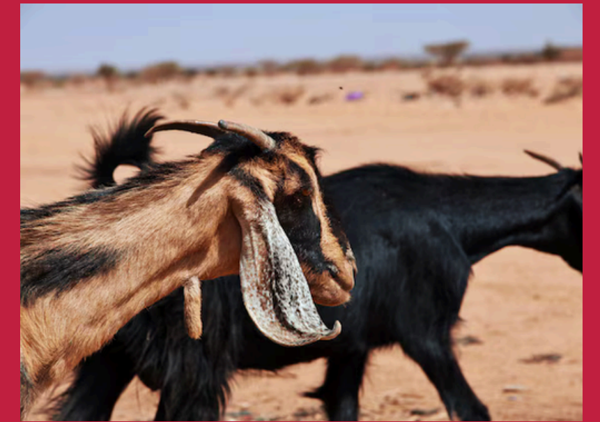
Kozy na sudańskiej pustyni