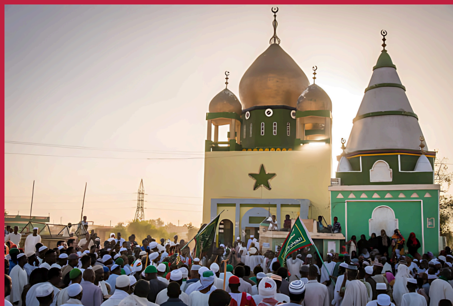
Ceremonia Sufi w grobie Hamad al-Nil w Omdurman