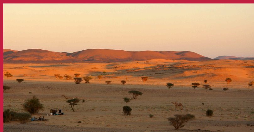
Krajobraz Sudanu (fot. Wikimedia)