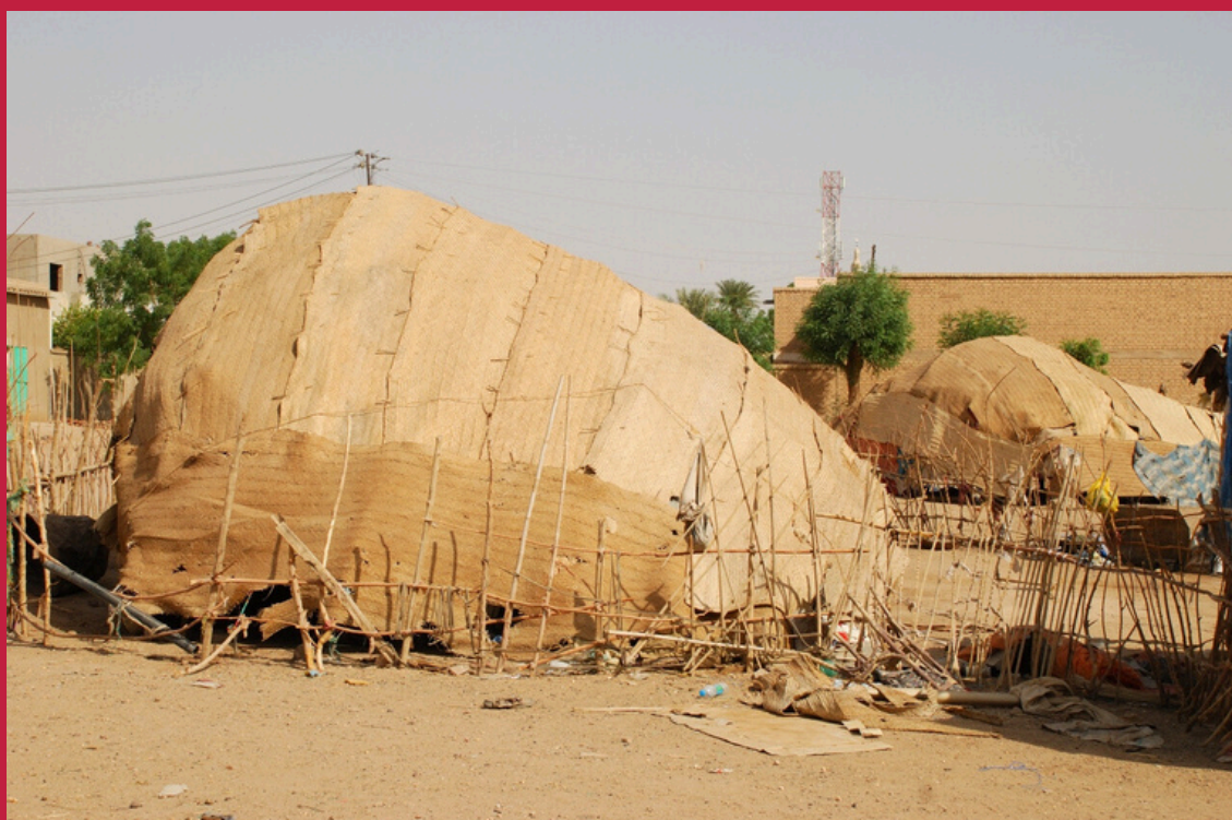
Społeczność i zabudowania Bedża