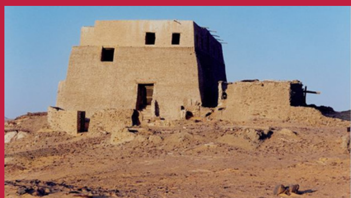
Stara Dongola