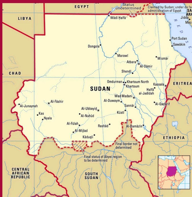
Mapa Sudanu