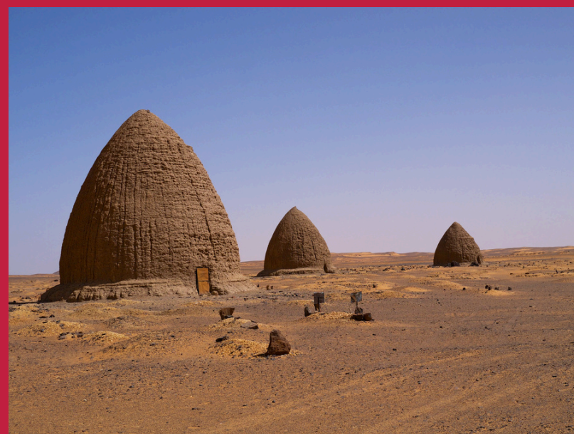
Islamskie grobowce i sanktuaria ( qibab ), Stara Dongola